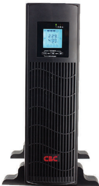
Rack mount ขนาด 3 U